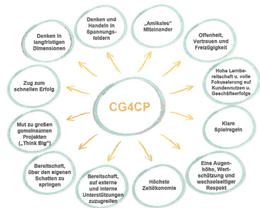
Die zwölf Erfolgsprinzipien der CG4CP